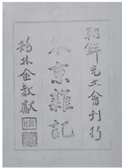
1. 東京雜記 표지