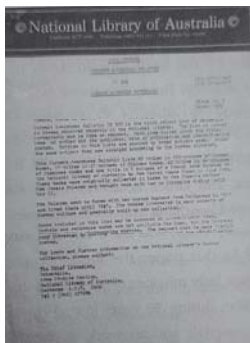
3. 호주국립도서관의 맥라렌-휴먼 장서 안내 문 표지