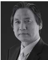
| 공기화 |

바쁘다는 핑계로 아이들과 잘 놀아주지 못했다. 아이와 놀아주는 게 당연히 해야 할 일과인 미국의 아빠다. 그들은 일과를 마치고