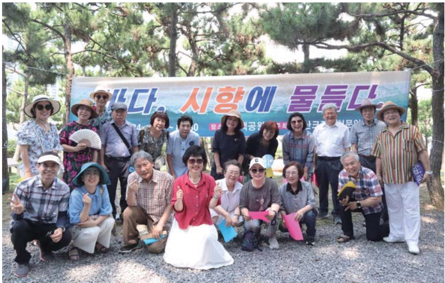
해운대 동백섬 시화전