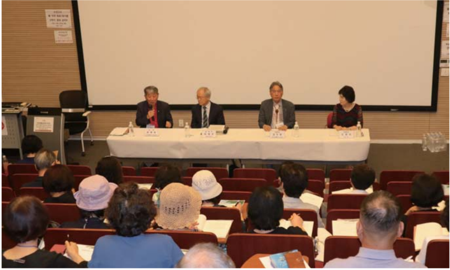
1. 일제 강점기 마라연 부인의 한국학 연구가 부산 문화예술에 끼친 영향 - 발제자 : 이상규