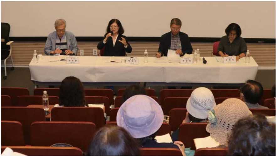
2. 김말봉의 문학과 사상(장편 『짚레꽃』과 『밀림』을 중심으로) - 발제자 : 박정선