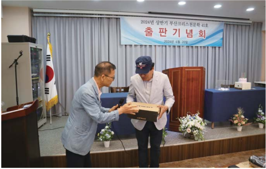
부산크리스천문학 제41호 출판기념회